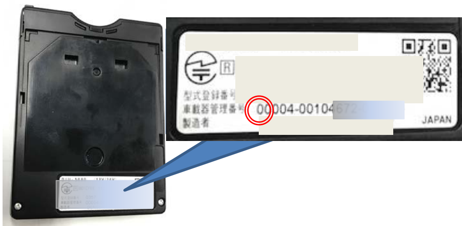
(写真): 旧セキュリティ対応車載器